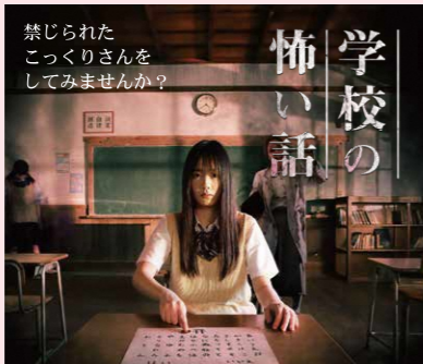
禁じられた こっくりさんを してみませんか?