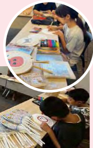
※材料がなくなり次第終了